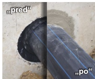
prestupy: malta SBM + bentonit