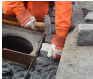
kladenie žulových kociek