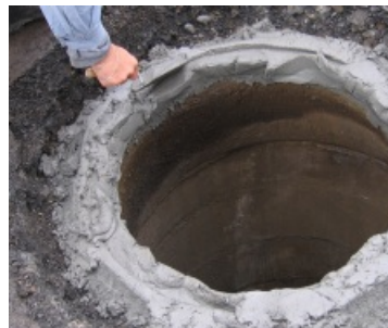
plastická konzistencia malty nesteká do šachty