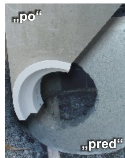
osadenie šachtových vložíek