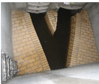
rychle vymurovanie šachtového dna