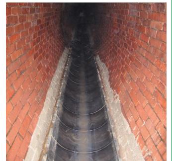
kladenie čadičových tvaroviek