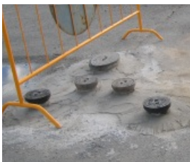
kladenie šachtových rámov, dažďových vstupov a ostatných armatúr v komunikáciách