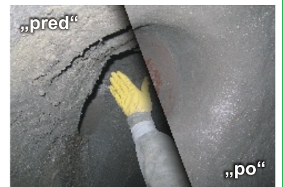
zabudovanie zaústenia prípojk