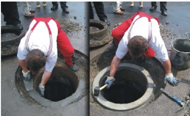
kladenie vyrovnávacích prstencov

univerzálna, vysokopevnostná, opravná malta na výstavbu a sanáciu kanalizácií za priaznivú cenu